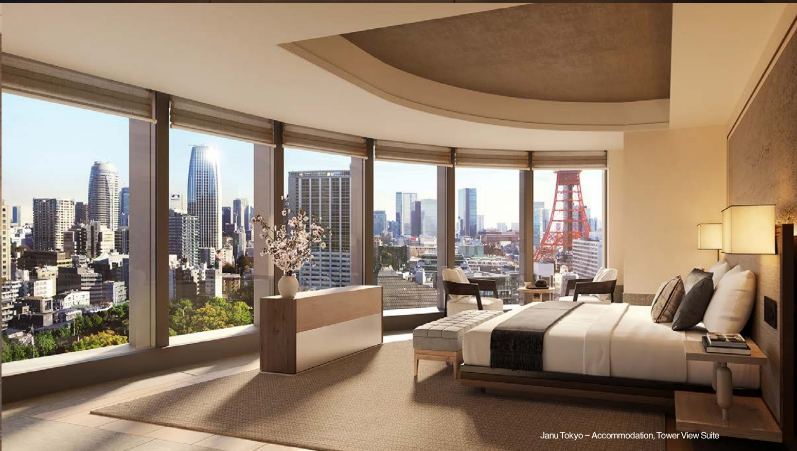
Janu Tokyo - Accommodation, Tower View Suite