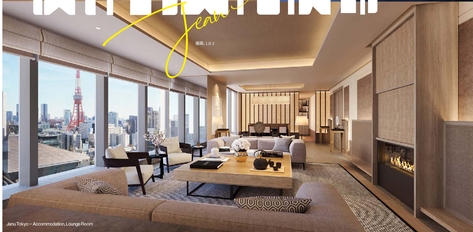
Janu Tokyo - Accommodation, Lounge Room