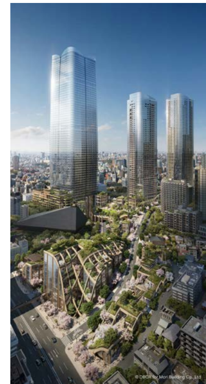
Janu Tokyo