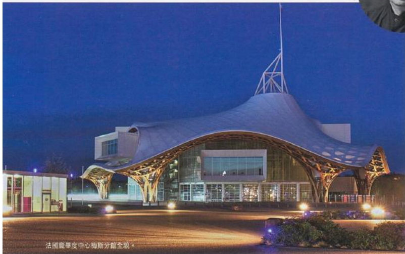
法國慶畢度中心梅斯分館全貌。

伊東豐雄、丹下健三等入後，第七位獲獎的日本建築師。其時評審讚賞他對建築擁有豐富知識，並著重新的物料與科技，不斷追求創新，其建築作品還為遭受重大損失與傷害的民眾提供棲身之地。評審指出，坂茂不僅為顧客設計出充滿創意的方案，還在人道主義領域作出貢獻，對其20年來走訪世界各地災區，協助災民以低成本建造可循環利用的收容所及住房，給予高度肯定。