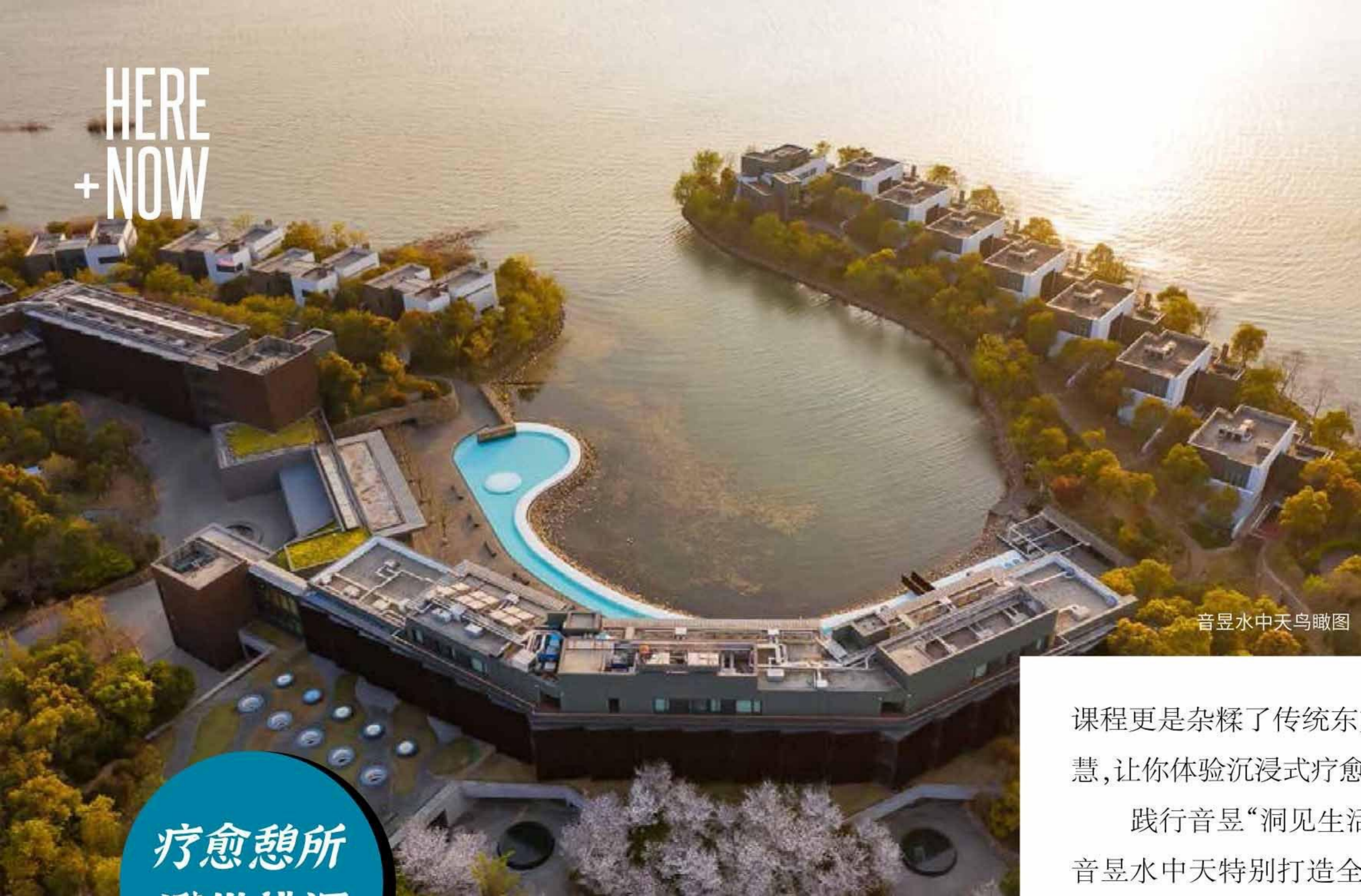
音昱水中天鸟瞰图