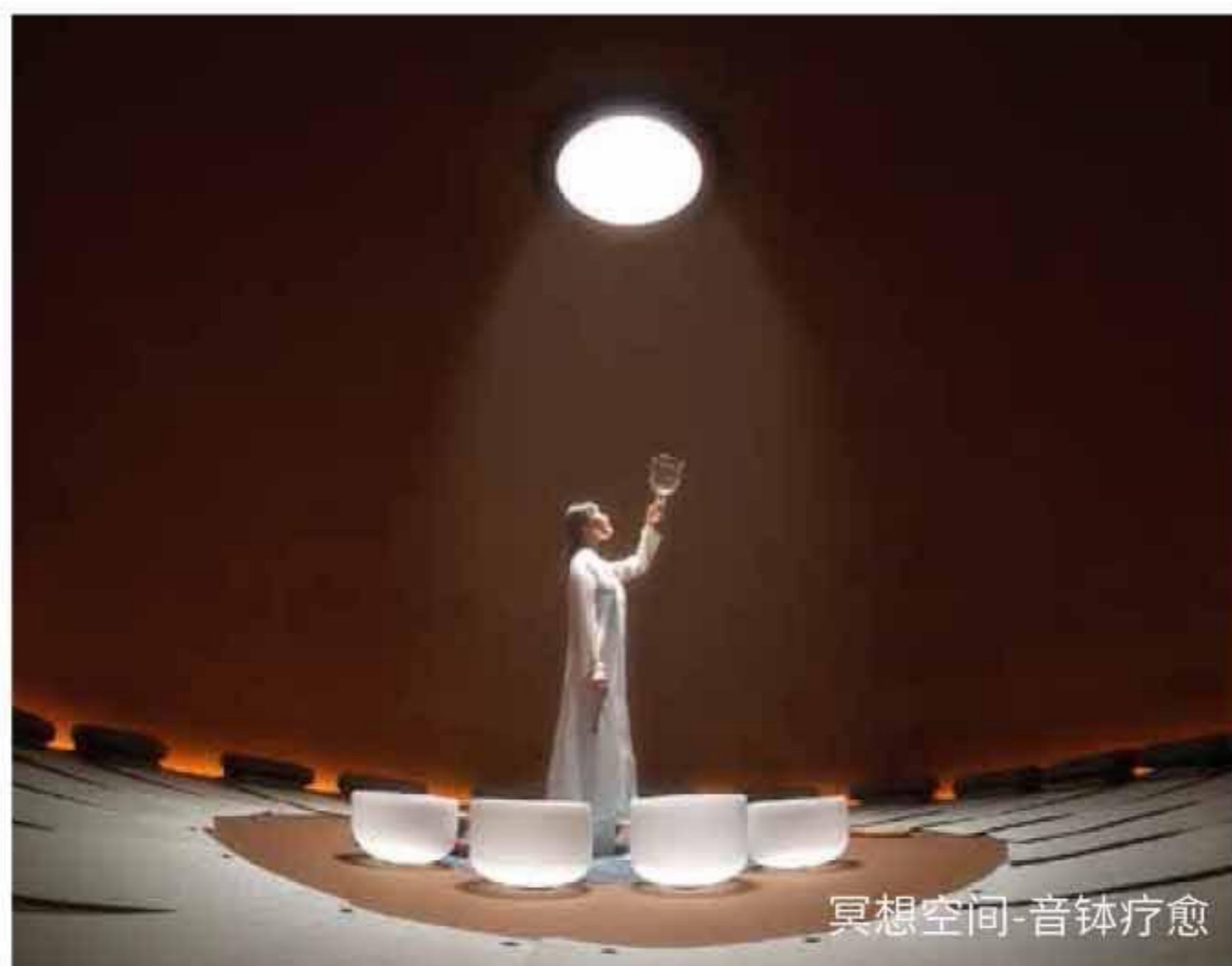
冥想空间-音钵疗愈