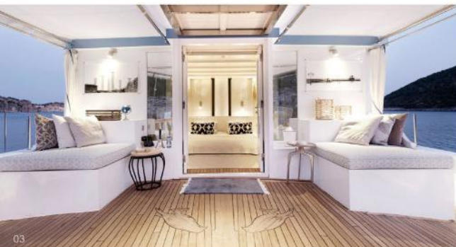
01-03 設計精巧的 ALEXA J 帆船遊艇兼具復古魅力與現代舒適。這艘超級遊艇僅設一間 VIP 主客艙，並可為小家庭提供一間額外的多用途遊樂室，呈現別具一格的住宿體驗。

秉持可持續核心理念的奢華度假村運營商 Soneva 與 ALEXA Private Cruises 攜手合作，共同呈現無與倫比的馬爾代夫私享假期，開啟 ALEXA J 遊艇印度洋巡航之旅。