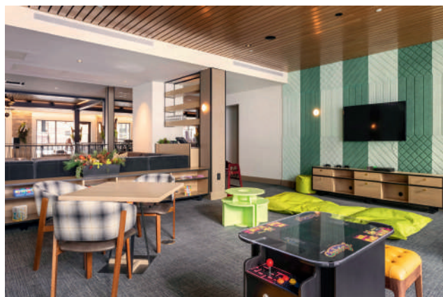
本页左上起顺时针 阿斯本的小镇亮灯时分。/ The Little Nell酒店客房。/ Limelight Hotel Snowmass室内充满活力的色彩。对页左上起顺时针 The Little Nell酒店的Ajax Tavern酒馆。/ 让人惊艳的薯条。/ Limelight Hotel Snowmass的攀岩墙。/ 阿斯本是美国著名的滑雪圣地。

雪季时节的四座山峦各自独立又各具特色。由 17 条索道连接的雪堆山是四座山峰中最大的, 雪道非常宽阔, 适合一家老小结伴滑行; 奶油山被认为最容易上手, 初学者在极其开阔的坡地上练习, 高手则在上方的地形公园里炫技; 阿斯本高地的蓝道经常被专业训练队占据, 最高处则有一片属于野雪高手的碗状地形; 阿斯本山是开发历史最久的中高级别雪场。而通往山顶的最长的那座银皇后吊车时不时会出现蓝牙音箱车厢, 手握以网飞动画《小真与彩虹王国》中云朵角色形象设计的索道票, 钻进幸运吊厢里, 你就能播放属于自己的雪山之歌。