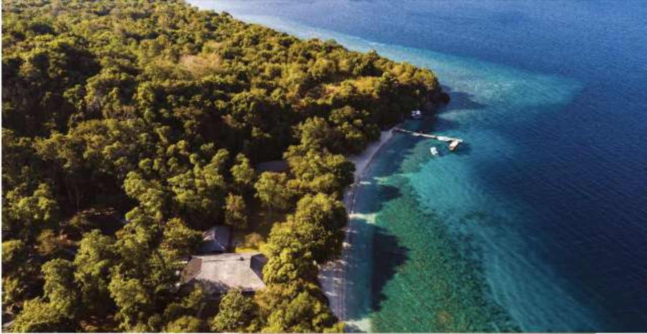
แคมป์ Amanwana เป็นสถานที่พักหนึ่งเดียวบนเกาะโมโย (Moyo Island) เกาะส่วนคิงในประเทอินโดนีเซีย