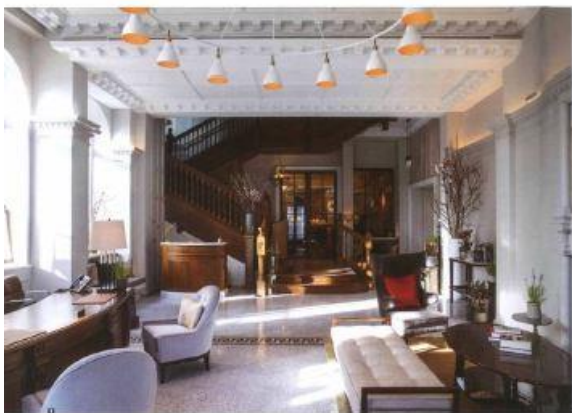
120 TOP ARCHITECTURE

泰晤士河北岸的伦敦切尔西，是这个城市最贵的居住街区，也是伦敦文化与社交最深的交汇之处。这里汇集了摩登瞩目的当代艺术、艺术展览、音乐剧等，以前所未有的速度重塑酒店 Belmond Cadogan Hotel 诞生于此。Belmond Cadogan Hotel 是一栋拥有古老历史与文化痕迹的哥德式建筑。经过历时 12 个月、历时 1000 万英镑的改造，这座历史悠久的酒店焕发生机。重新翻新的酒店保留了建筑及 19 世纪特有的文化传统，同时引入现代设计升级，将皇家酒店与现代风格、传统建筑完美结合。精心设计的古董与现代艺术作品的交汇充满戏剧张力，将富有魅力的空间重新塑造为现代伦敦的缩影。