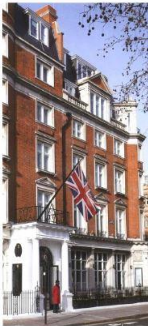
WWW.CADOGAN.COM | 121

波西米亚风格是一种文化传统，它起源于 19 世纪末，是一种对东方艺术、文学和音乐的崇拜。波西米亚风格是一种文化传统，它起源于 19 世纪末，是一种对东方艺术、文学和音乐的崇拜。